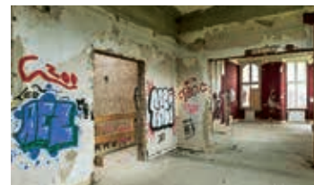
Im Haus wüteten Vandalen. Jetzt wird eine neue Nutzung gesucht

D ie einst imposante Villa am Meer sieht jeder, der an der Strandpromenade, genauer Ostseepromenade, genauer Ostseepromenade, genauer Ostseepromenade vorbei kommt. Und fast jeder fragt sich: Was soll diese Ruine? Die Älteren kennen das Haus noch mit Nachtbar, Friseur und Sauna aus der DDR. Seither gab es mehrere Besitzer, das Gebäude verfällt. Doch es gibt Hoffnung.