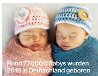
Rund 778 000 Babys wurden 2019 in Deutschland geboren

S eit 1996 veröffentlicht der Hobby-Namensforscher Knud Bielefeld aus Ahrensburg bei Hamburg eine repräsentative Liste der 1 000 beliebtesten Vornamen. Ob dem Wirtschaftsinformatiker das auch für 2020 gelingen sollte, stand bis zuletzt nicht fest: Für üblich zieht Bielefeld die