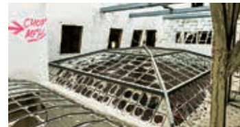
Blick vom Dachboden auf das zerstörte Kuppeldach eines Salons

Einst prächtig, heute tristesse: Die Villa ist ein Sanierungsfall, kann aber laut Gutachten gerettet werden