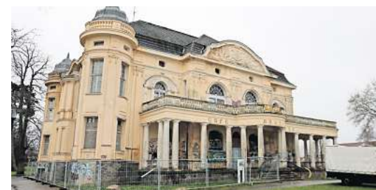
Die Villa Baltic in Kühlungsborn droht zu verfallen. Konkrete Ideen werden in diesem Frühjahr erwartet.