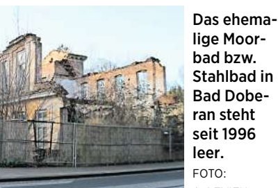
Das ehemalige Moorbad bzw. Stahlbad in Bad Doberan steht seit 1996 leer.